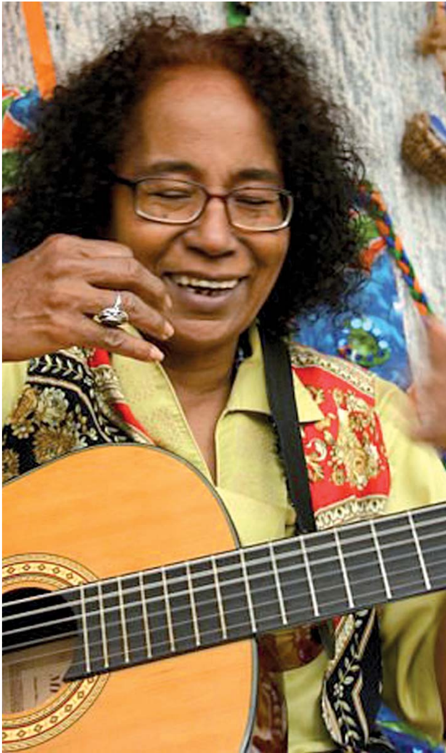
A paraibana Cátia de França é uma das maiores cantoras e compositoras brasileiras