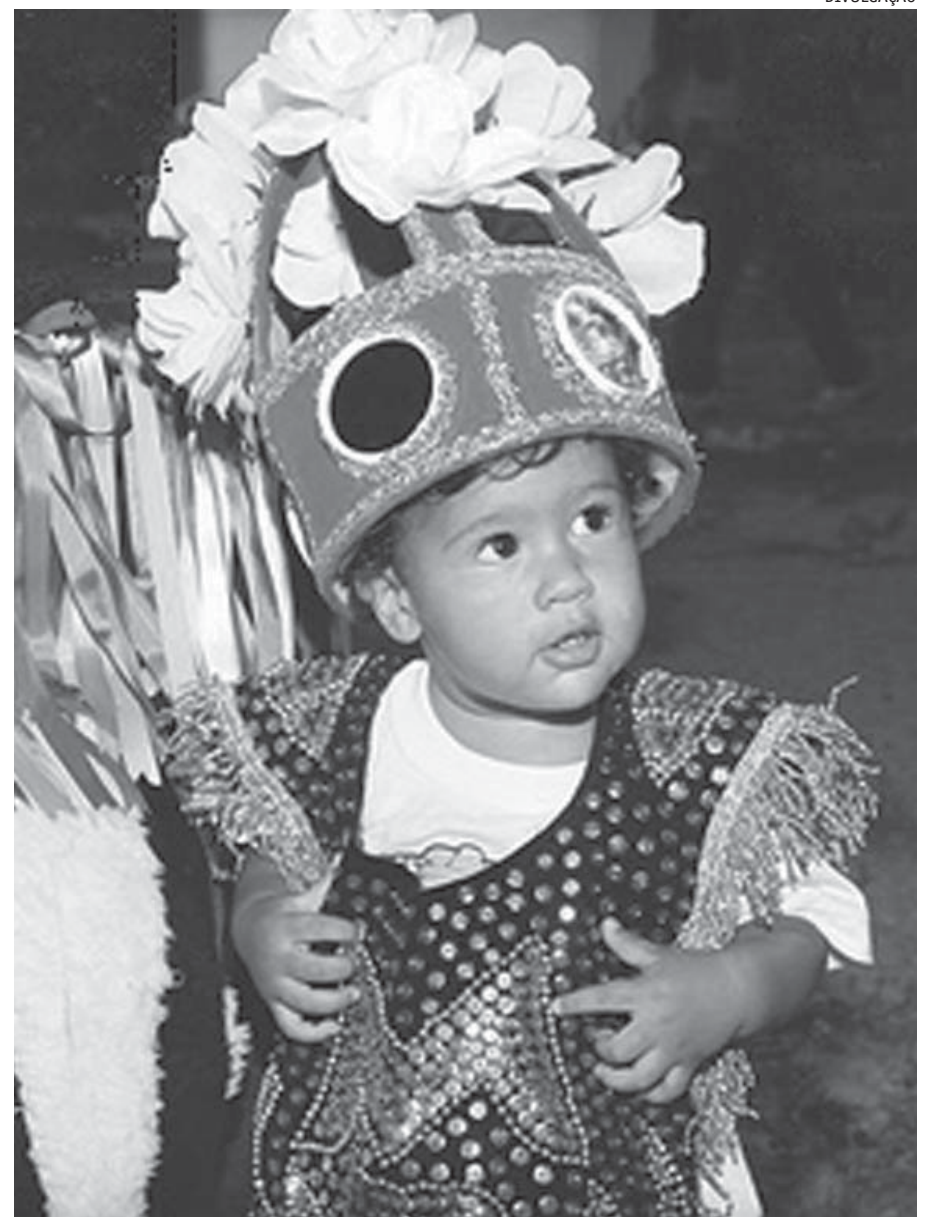
Além da criação do cineclube, projeto promove resgate de manifestações populares