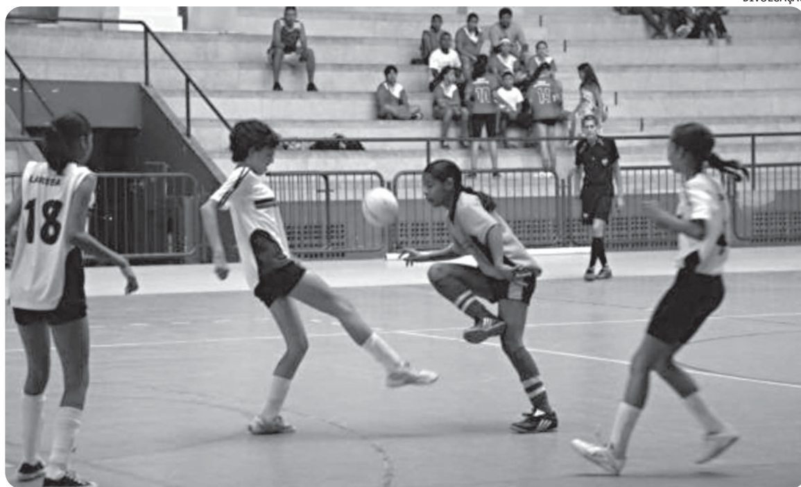
O futsal feminino dos Jogos Escolares da Paraíba está sendo disputado no ginásio do colégio Marista Pio X