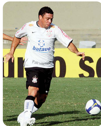
Ronaldo está bem motivado

Nem isso convenceu Ronaldo a rasgar elogios ao Inter. "Não existe mistério no futebol. Independentemente de quem assuma o favoritismo, nada vai