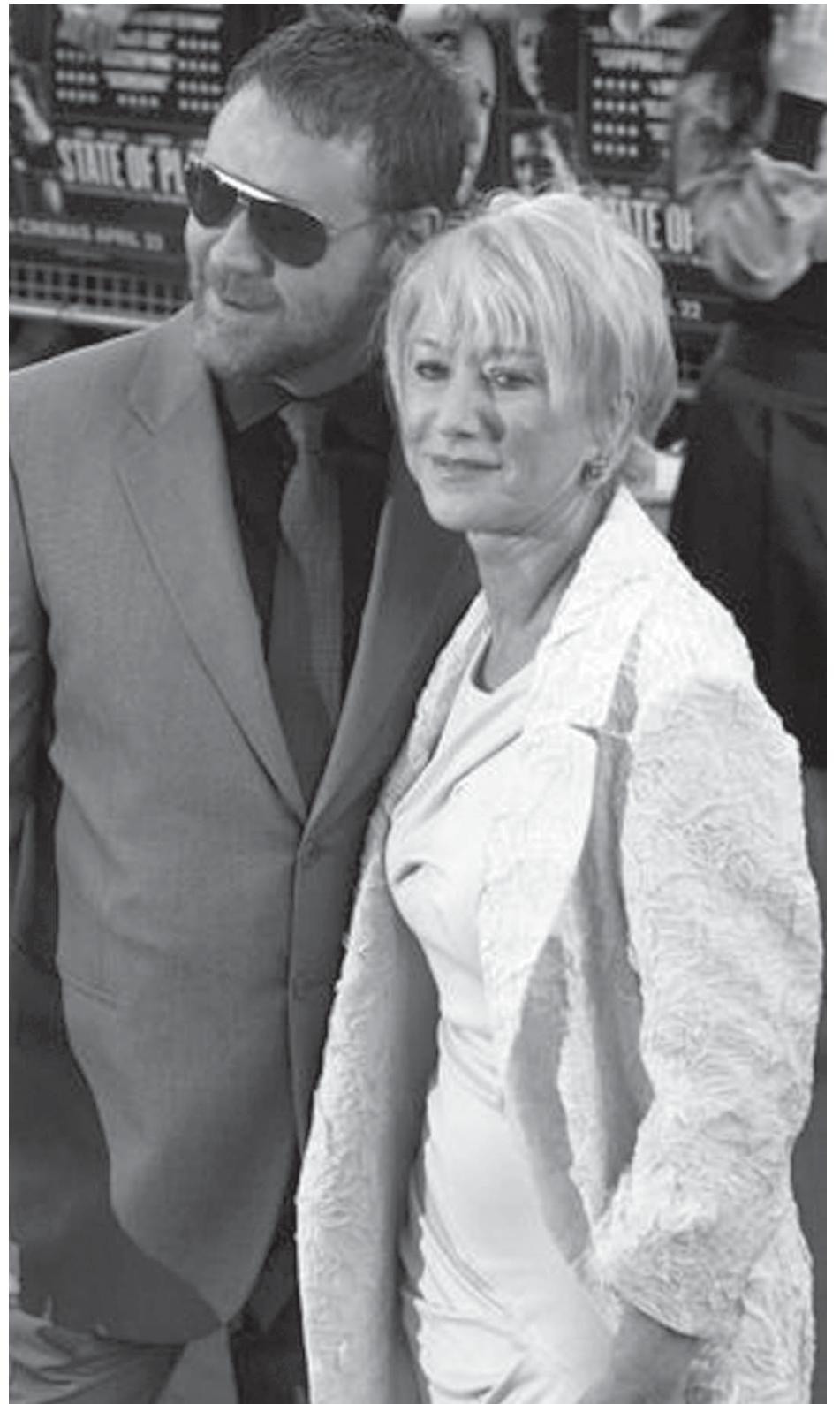
Russel Crowe e Helen Mirren estão no elenco de 'Intrigas de Estado', ainda em cartaz

37 BANCO 3/sad, 4/leme, 5/diana — tbia, 10/nabillar.