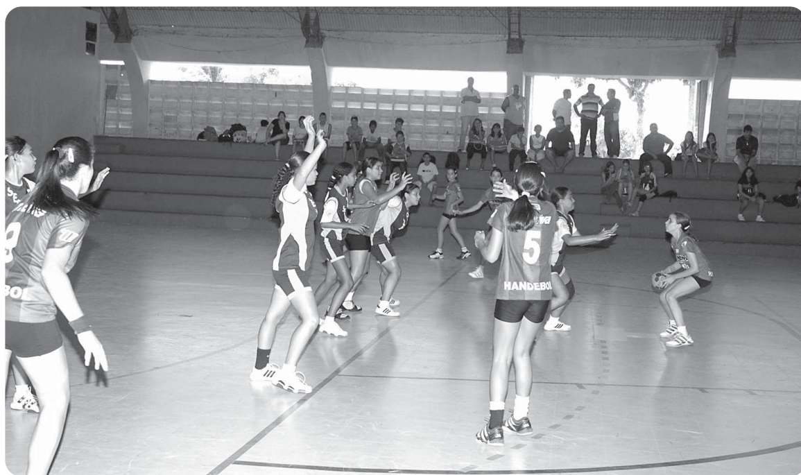
Os jogos de handebol serão decisivos hoje e todos estão programados para o ginásio do Dede