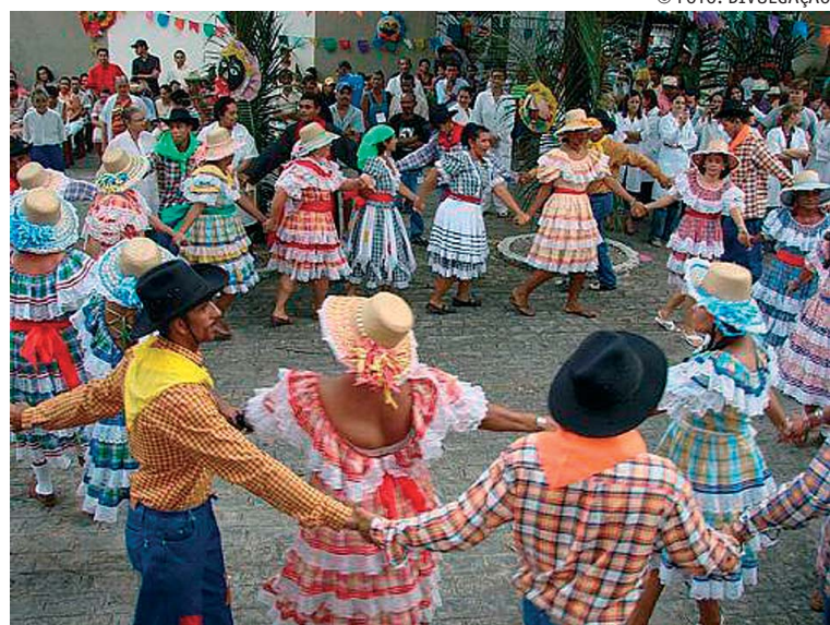
Quadrilhas juninas integram os festejos das entidades filantrópicas