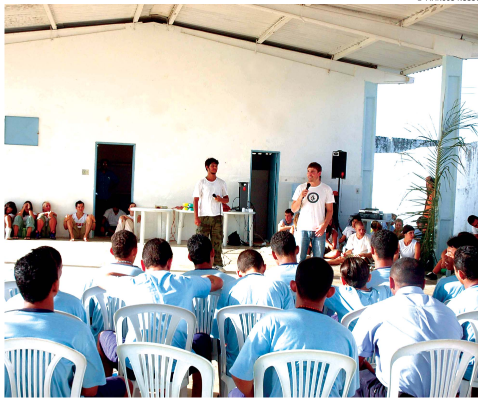
Além da pregação da palavra de Deus, o grupo apresentou malabarismos e fez exibição de esportes de ação

Organização sem fins lucrativos, o grupo foi criado em 1997 e, ao longo desse período, já realizou, em presídios federais, estaduais e municipais, escolas municipais e estaduais e em centros de reabilitação para menores em conflito com a lei, mais de 1.200 apresentações, em vários Estados do Brasil e, inclusive, do exterior, tendo promovido a ressocialização de um milhão de pessoas.